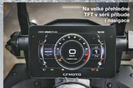
Na velké přehledné TFT v sérii přibude i navigace

Komfort opravdu nepostrádám, byť samozřejmě na padesáti kilometrech nepoznám, jaké to bude po celém dni ježdění. Sedlo je ale příjemné a u výškově nastavitelného plexi mi chybí jen pár centimetrů k dokonalému krytí (s mými 200 cm). Na motorku si vůbec nemusím zvykat, hned jsem doma. A ta hmota přede mnou je ve finále fakt příjemná. Tak si tak pluju, říkám si, jak se jim to povedlo, jak MT nejen dobře vypadá, ale i jede. Na trh by měly přijít hned dvě verze – silniční na loukotích a víc offroadová na drátech. Podstatná bude samozřejmě cenová politika, ale je jasné, že tohle bude sakra hodně muziky za slušnej peníz. //