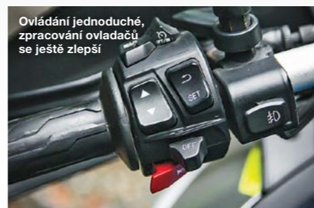
Ovládání jednoduché, zpracování ovladačů se ještě zlepši