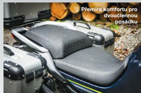
Přemíra komfortu pro dvoučlennou posádku