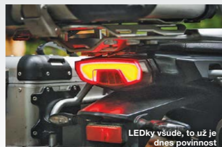
LEDky všude, to už je dnes povinnost